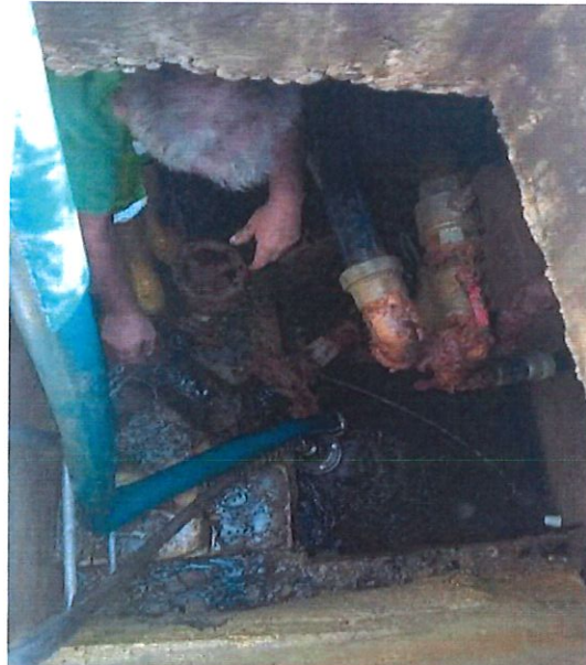
Punto di localizzazione intervento – Via Santo Stefano, angolo Via Roma - Silvi

Si comunica che mercoledì 20/09/2023, dalle ore 7:30 alle ore 18:30 , è previsto l'intervento di manutenzione straordinaria della rete distributrice di cui all'oggetto e per la quale sarà necessario interrompere il flusso idrico dal Serbatoio di Santo Stefano dalle ore 08:30 alle ore 16:00 , salvo complicazioni. Per non chiudere la strada e per consentire comunque il passaggio delle auto sul lato destro della carreggiata a senso unico, i tecnici ACA Spa provvederanno ad installare nel pomeriggio di martedì 19/09/2023 appositi divieti di sosta, per metri 50, fino all'incrocio di Via Santo Stefano con Via Roma - S.S. n° 16 nord.